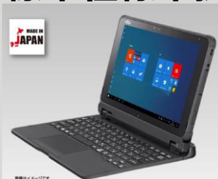
ARROWS Tab GIGAスクールモデル