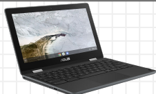
ASUS Chromebook Flip C214MA