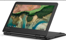
Lenovo 300e Chromebook 2nd Gen